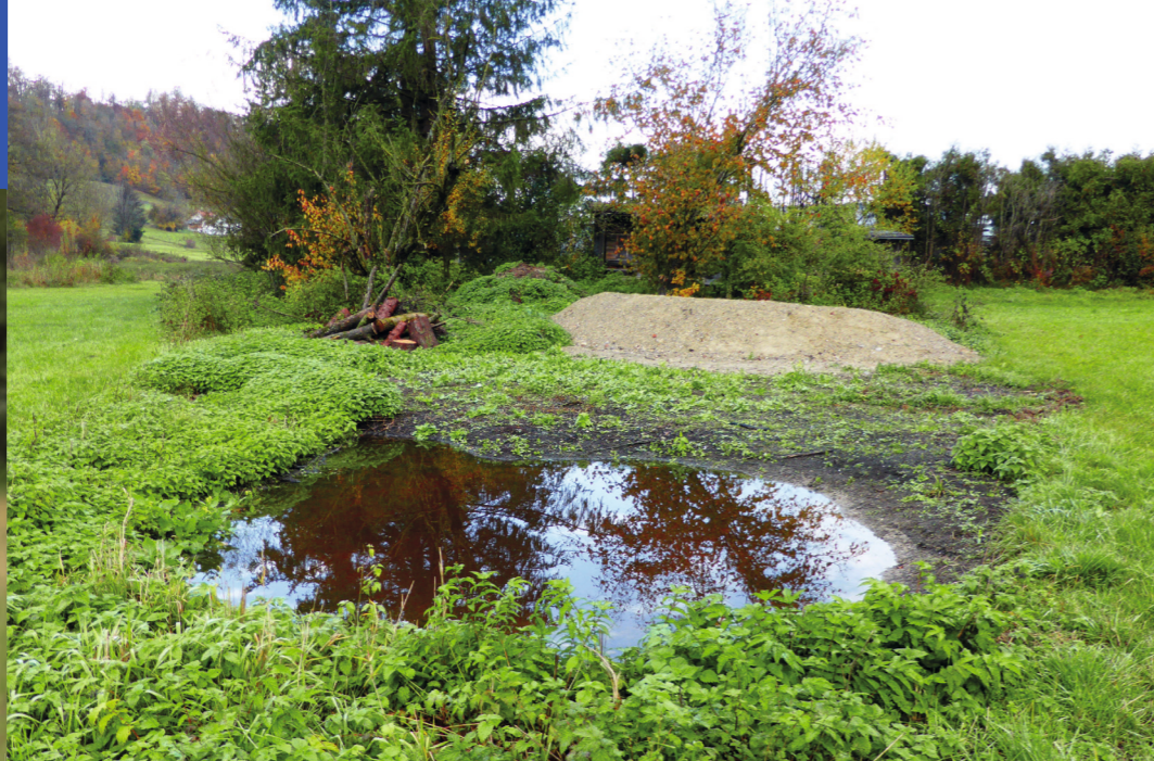
Neu angelegtes Mikrohabitat: die Biotopstrukturen Wasserfläche, Nisthügel und Totholz sind bereits fertig gestellt. Für den Blütenreichtum müssen wir noch auf das nächste Frühjahr warten.