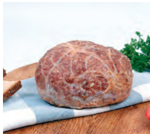
Ostheimer Leberkäs, Bayrische Rhön