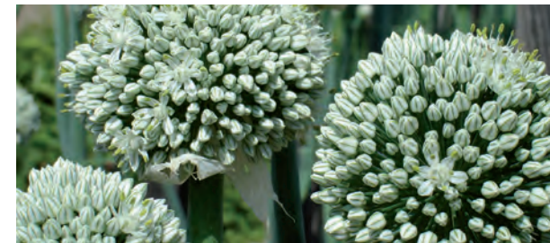
Höri Bülle, Bodensee

Slow Food ist ein internationaler Non-Profit-Verein, der 1986 in Italien als Antwort auf die rasante Ausbreitung des Fastfood und des damit einhergehenden Verlustes der Esskultur und Geschmacksvielfalt gegründet wurde. Heute ist Slow Food eine weltweite Bewegung, mit gut 80.000 Menschen in rund 100 Staaten. Insgesamt rund 750 Convivien (lat. für Tafelrunde) – die regionalen Gruppen von Slow Food – organisieren viele Veranstaltungen und Zusammenkünfte mit dem Ziel, regionalen Geschmack kennen zu lernen und das Wissen um die Geschmacksvielfalt sowie deren Bedeutung zu fördern.