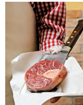
Beinscheibe vom Weideochsen

Eigenschaften und seiner Robustheit wird das Original Braunvieh auch heute noch in den großen Ländern der Rindfleischproduktion, wie Brasilien und Kanada, sowohl als Kreuzungspartner mit Lokalrassen eingesetzt als auch in Reinzucht-herden gehalten. Höchste Zeit also, dass im Allgäu, dem deutschen Ursprungsgebiet, den Qualitäten dieser alten Rasse wieder mehr Aufmerksamkeit gewidmet wird. Vermehrt hinterfragen bewusste Verbraucher die Bedingungen in der modernen Intensivlandwirtschaft: Warum füttern wir unsere Nutztiere mit Soja und Mais aus anderen Erdteilen? Im Sinne einer echten Nachhaltigkeit in der Milch- und Fleischproduktion sollten die Rinder wieder hauptsächlich von dem ernährt werden, was ihrer Natur entspricht: von Gras. Da können die Original Braunen ihre Qualitäten als guter Grundfutterverwerter voll entfalten.