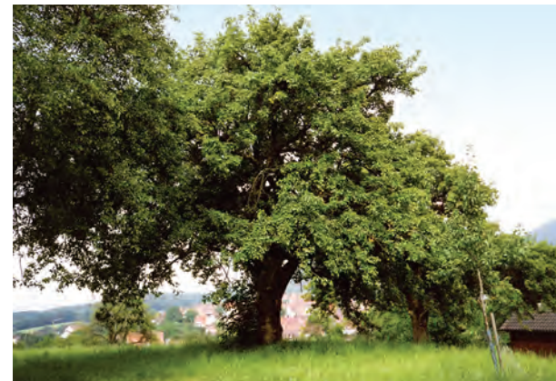
Birnbäume der Champagner-Bratbirne, Schwäbische Alb

Das Presidi-Projekt wurde von der Slow Food Stiftung für biologische Vielfalt im Jahr 2000 ins Leben gerufen, weil ein aktiver Schutz der jeweiligen Archepassagiere über die Sammlung und Beschreibung hinaus notwendig geworden war. Das Presidio (ital. für Schutzraum) ist ein Netzwerk geknüpft von aktiven Produzenten und engagierten Slow Food Mitgliedern, Lebensmittelhändlern, Experten sowie interessierten Gastronomen, Köchen, Förderern und Touristikern. Sie erarbeiten gemeinsame Aktivitäten anhand folgender Kriterien: