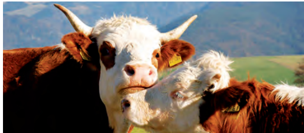
Hinterwälder Rind, Südschwarzwald

Das internationale Slow Food Projekt zur Erhaltung der Biodiversität, von der Slow Food Stiftung für biologische Vielfalt 1996 gegründet, schützt weltweit fast 1.000 regional wertvolle Lebensmittel, Nutztierarten und Kulturpflanzen vor dem Vergessen, indem sie in die Arche des Geschmacks aufgenommen werden.